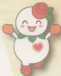
白石区マスコットキャラクター しろっぴー